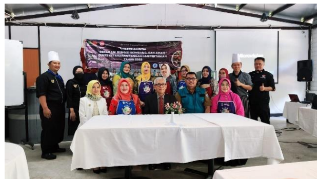
Gambar 3. Foto Dokumentasi