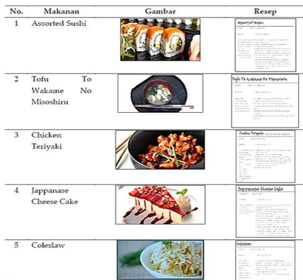
Tabel 2. Standar resep pembuatan makanan lengkap

Standar Resep diatas dibagikan secara langsung kepada para peserta Pelatihan, untuk dapat dipelajari dan kemudian dipraktikkan secara langsung, dibuat makanan sesuai Standar Resep yang dilakukan di Laboratorium pengolahan pangan Universitas Medika Suherman. Kegiatan yang dilakukan pada saat pelatihan terlihat pada Gambar 1.