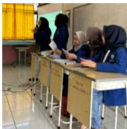
Gambar 2. Sosialisasi Program PkM

Setelah seluruh materi disampaikan oleh tim pengabdian, kegiatan dilanjutkan dengan pelaksanaan post-test sebagai lanjutan dari pre-test yang sebelumnya dilakukan sebelum penyampaian materi. Tujuan dari post-test ini adalah untuk mengukur sejauh mana pemahaman peserta terhadap materi yang telah diberikan. Hasil post-test menjadi tolok ukur keberhasilan kegiatan pengabdian, sekaligus membantu tim pelaksana menilai peningkatan pengetahuan peserta setelah mengikuti kegiatan. Sebanyak 80 siswi SMPN 1 Karang Bahagia yang menjadi mitra dalam program PkM ini telah menyelesaikan seluruh rangkaian pre-test dan post-test. Tim pengabdian memberikan 20 soal dengan bentuk pertanyaan yang sama pada kedua tes. Hasil dari pre-test dan post-test ini akan dianalisis dan dibandingkan guna mengetahui perkembangan nilai akhir yang dicapai oleh peserta.